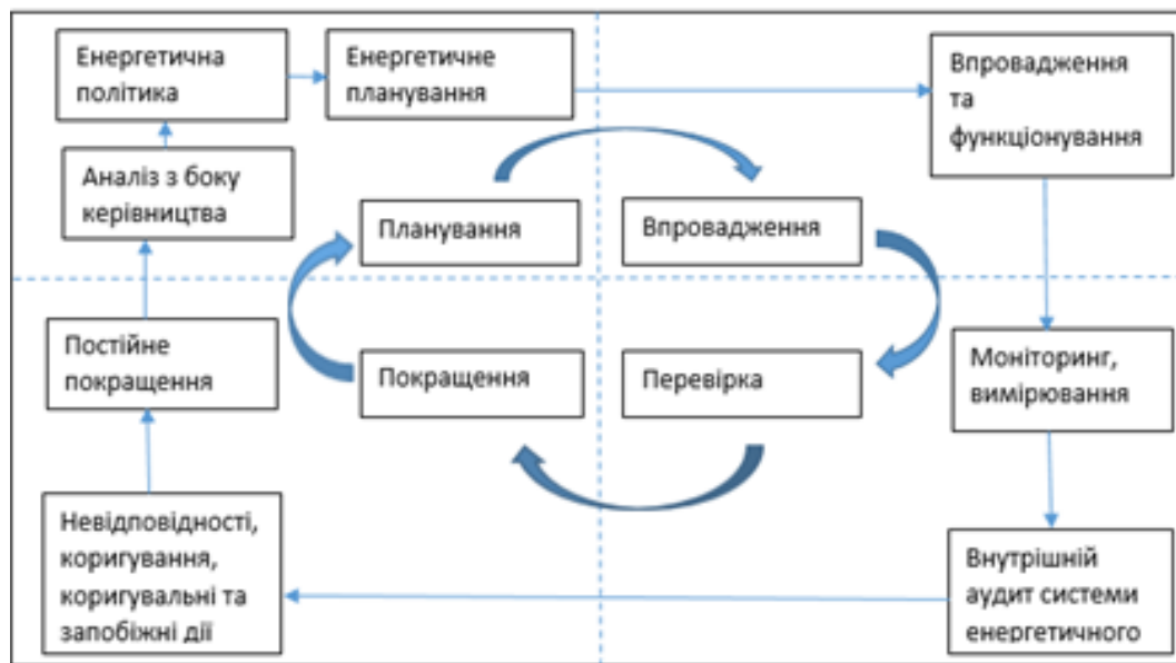
Рис. 1. Схема системи енергетичного менеджменту відповідно до ISO 50001

Управління споживанням енергії розглядається не тільки як інструмент для зменшення обсягів енергоспоживання та витрат на оплату енергоносіїв бюджетними установами та закладами, що утримуються за кошти бюджету міської територіальної громади, але й як шлях до підвищення якості комунальних послуг, комфортності перебування у будівлях.